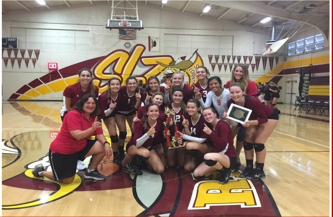
Las chicas de vball de Liberty ganaron 1er lugar en el torneo de San Leandro el 29 de agosto.

Estas 5 seniors han marcado un tono de trabajar bien en equipo, dedicación, y fuego competitivo con metas de ganar un título en la liga y avanzar a las finales de la sección de la costa norte. Cada senior reconoce su papel de líder para lograr estas metas y asegurar una química positiva en el equipo. “Queremos comparar nuestros